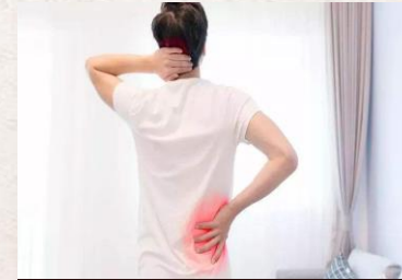
Populasi kurang sehat

Pada orang tua sering terjadi qi dan darah tidak bebas, penyumbatan saluran dan pembuluh darah, menyebabkan rematik sakit kaki dan punggung.