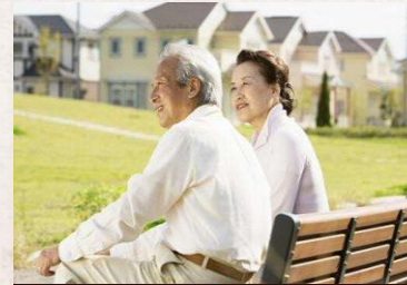
orang paruh baya dan tua

Tekanan dari pekerjaan, kehidupan dan keluarga menyebabkan ketegangan saraf, ketegangan otot, dan usaha untuk melepaskan tekanan dari orang banyak