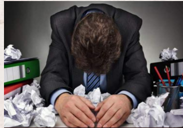
Populasi stres tinggi

Pekerja kantoran duduk lama atau berdiri lama. Mereka kurang berolahraga dan mempertahankan satu posisi untuk waktu yang lama. Hambatan qi dan saluran darah serta pembuluh darah dapat dengan mudah menyebabkan nyeri bahu dan leher, ketidaknyamanan pinggang dan perut.